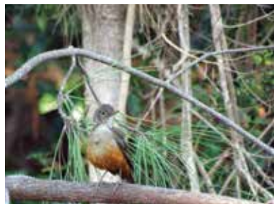
Aves avistadas nas áreas da Florestal Mostardas: Noivinha ( Xolmis irupero ); Chimango ( Milvago chimango ) Sabiá-Laranjeira ( Turdus rufigiventris ).