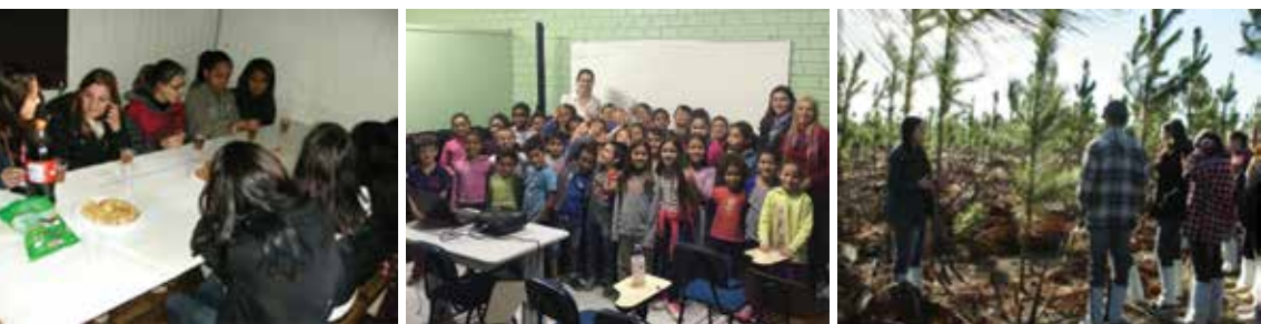
Apresentação das atividades executadas na empresa para escolas. / Alunos Lanchando no refeitório de campo / Visita de Campo com Alunos