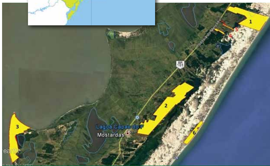
Hortos florestais da Florestal Mostardas localizados no município de Mostardas-RS.

A empresa possui 7.991,59 ha localizados no município de Mostardas – RS, ocupando um percentual de 3,80% da área do total do município, onde 4.591,52 ha são de efetivo plantio de Pinus spp. sendo o restante ocupado por estradas, aceiros, campos arenosos, campos úmidos, vegetação nativa, áreas de preservação, área de reserva legal, conforme segue na Tabela abaixo.