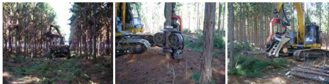
Sequência de fotos com diferentes etapas da colheita: corte, seccionamento e baldeio, em operação de Desbaste.