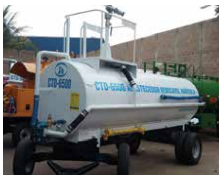
Tanque móvel utilizado para combate à incêndios.