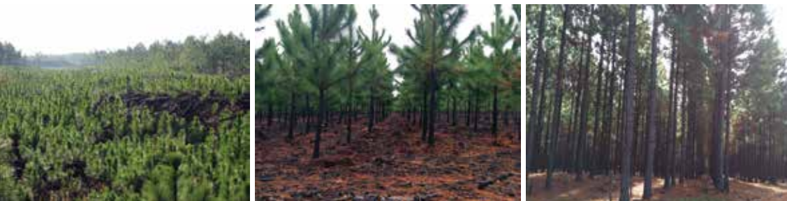
Sequência de fotos com diferentes fases de povoamentos provenientes da regeneração do Pinus elliottii na Floresta Mostardas.

Ao iniciar a segunda rotação destas áreas, após a primeira colheita, já na década de 90, deparou-se, com a capacidade de germinação espontânea do banco de sementes depositado no solo da floresta. Adaptando-se a nova realidade, foram desenvolvidas técnicas de manejo no sentido de aproveitar este potencial na formação de novos povoamentos, partindo para o conceito de rigorosa seleção fenotípica de indivíduos, conciliando a metodologia adotada com a viabilidade econômica do manejo.