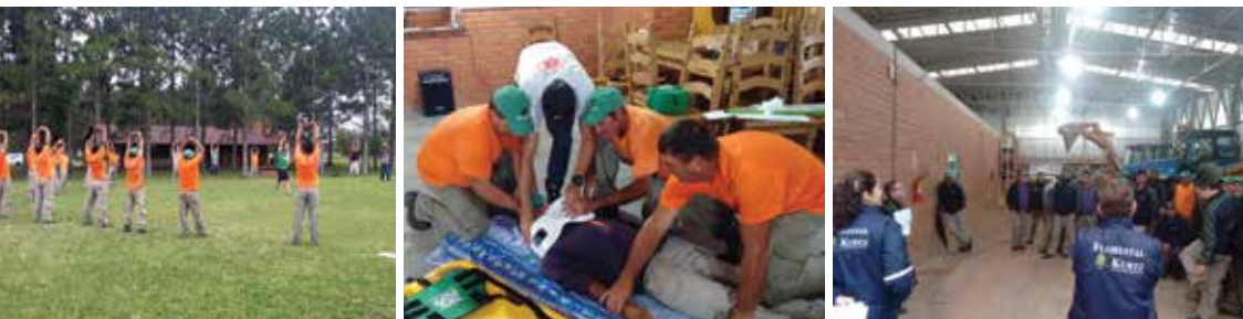
Treinamentos Florestal Mostardas de Ginástica Laboral, Primeiros Socorros e diálogos de segurança