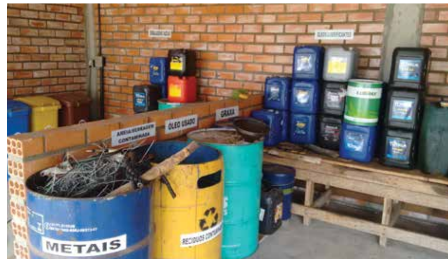
Coleta seletiva de resíduos.

A destinação de resíduos classificados como perigosos, no caso da empresa, resíduos contaminados com óleos ou graxas são transportados e destinados por empresas licenciadas pelo órgão ambiental.