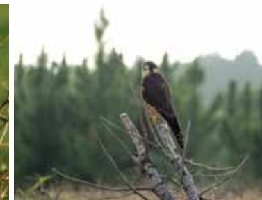
Aves avistadas em campo e florestas de Pinus nas áreas da empresa: Pica-pau-do-campo ( Colaptes campestris ), Tico-tico ( Zonotrichia capensis ), Falcão-de-coleira ( Falco femoralis ).